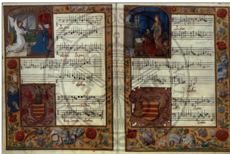
Слика 1: Пример приметног жига у слици (рукопису из Ватиканског музеја)

Следи пример приметног жига за слике. Слика једног манускрипта из Ватиканског музеја, која се појавила на Интернету, има уграђен приметни жиг, који подсећа на водени жиг на папиру. Овде је обавештење о власништву очигледно, али је слика ван комерцијалног значаја.